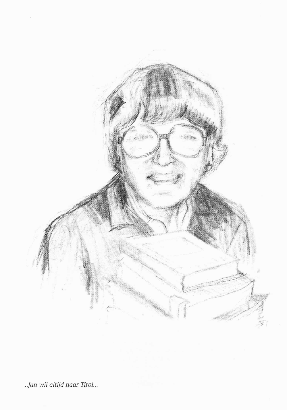
..Jan wil altijd naar Tirol...